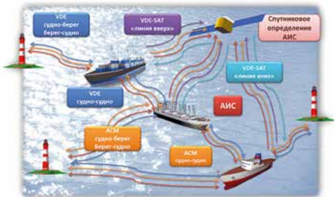
Рис. 3. Новая концепция морских коммуникаций для передачи данных в ОВЧ-диапазоне (VDES)

На ВКР-12 некоторые члены АРТ (Asia-Pacific Telecommunity) и СЕРТ выступили в поддержку первичного распределения радиолокационной службе в полосе частот 77,5–78,0 ГГц для ее использования специализированными автомобильными (automotive) радарными устройствами малого радиуса действия с высоким разрешением. При этом в ряде стран подобные радары до настоящего времени имели ста-