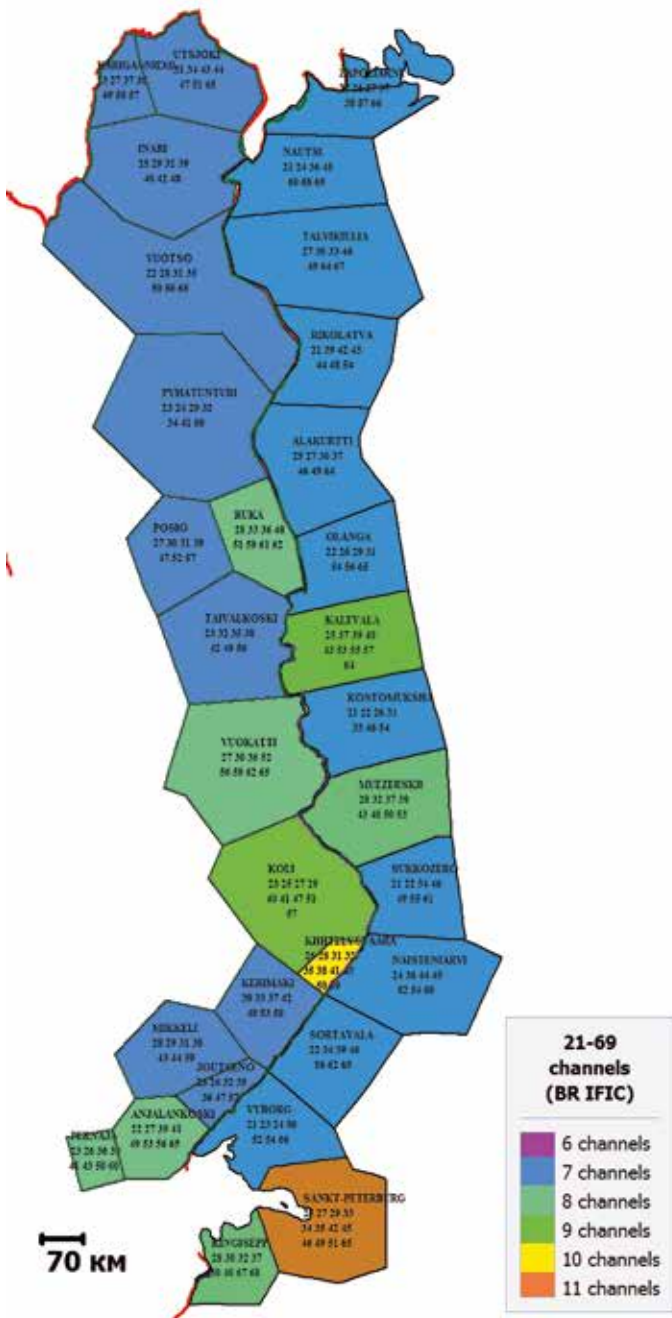
Рис 1. Зоны частотных выделений вдоль границы России с Финляндией

Таким образом, при осуществлении такого перепланирования потребуются решать множество общих и частных проблем технического, организационного, регуляторного